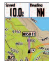
Optionale topographische Karte