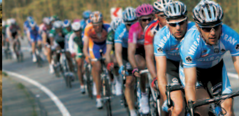
Official Supplier to Team Milram