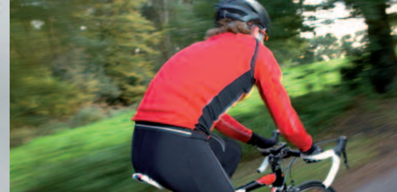
Tim Don - 2006 ITU Triathlon World Champion