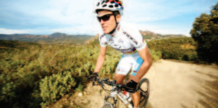
Julien Absalon - 2006 World & 2004 Olympic Mountain Bike Champion